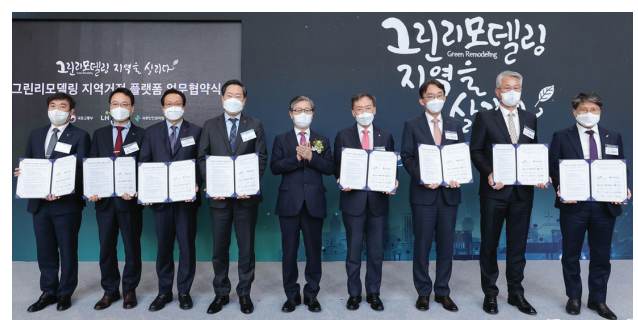
그림 1. 그린리모델링 지역거점플랫폼 협약식(국토교통부장관 변창흠(가운데) 및 6개 기관장)

2021년 1월 28일 국토발전전시관에서 국토교통부 장관(변창흠)과 6개 지역거점 기관장(총장)들이 협약식과 전문가 토론회를 거행하였다.(그림 1, 2 참조) ㉔